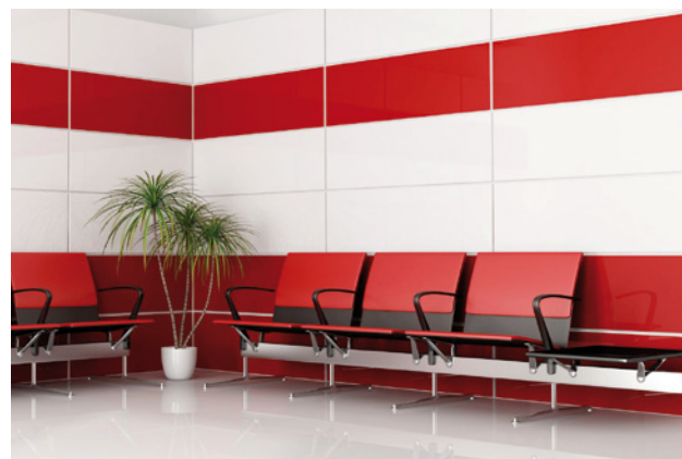
→ STRUTTURE PUBBLICHE